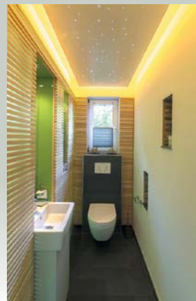
Gäste-WC Wandverkleidung aus Lärche mit indirekter Beleuchtung, Deckensegel als Sternenhimmel in Weißlack, Wandnischen mit Creacolor ESG-Glas in „Lemon“. Eigene Fertigung!